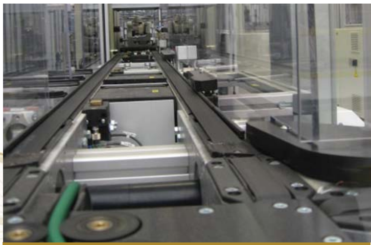
5S UND VISUELLE FABRIK